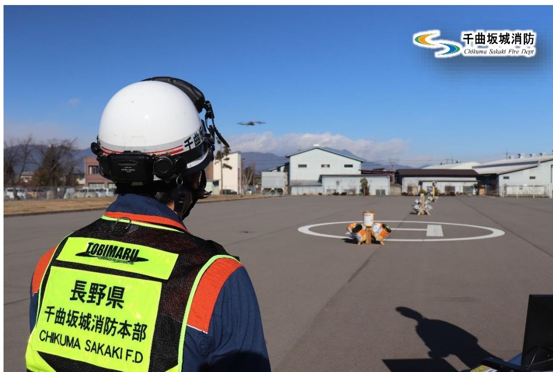
千曲坂城消防本部無人航空機隊「TOBIMARU（とびまる）」