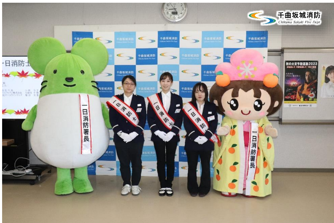
秋の火災予防運動 ～一日消防士～