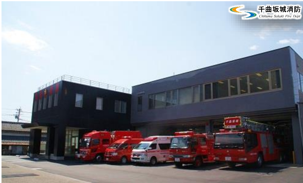
千曲坂城消防本部/戸倉上山田消防署庁舎