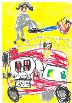
坂城幼稚園 上原 新大