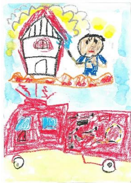
坂城幼稚園 松下 愛菜