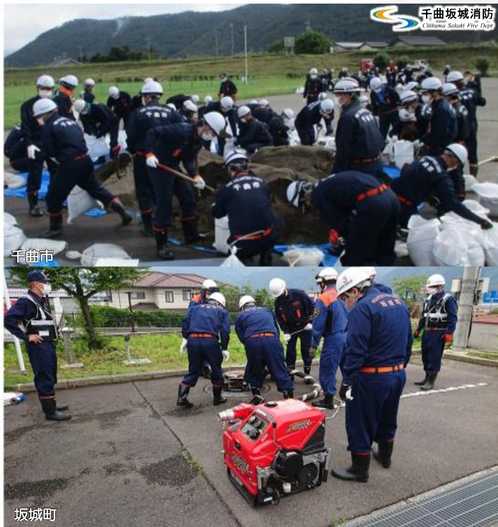
令和3年度訓練風景