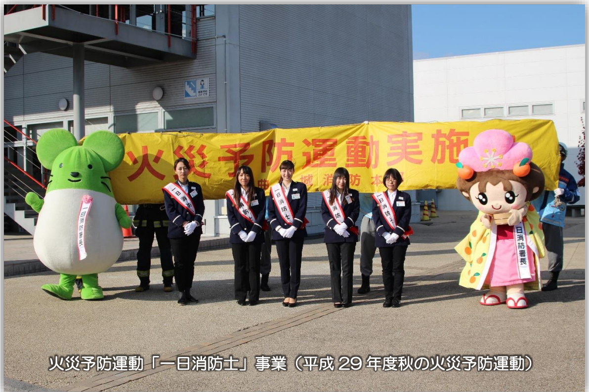
火災予防運動「一日消防士」事業（平成 29 年度秋の火災予防運動）