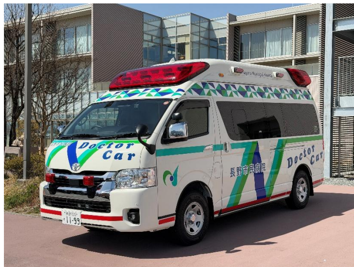
長野市民病院のラピッド・ドクターカー